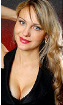
Marina 37 Jahre