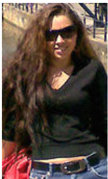
Ruslana 30 Jahre