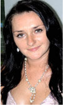
Marina 27 Jahre