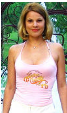
Oly 33 Jahre