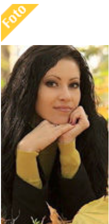
Vita 31 Jahre