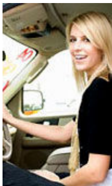
Alla 46 Jahre