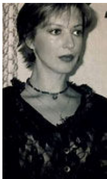
Veta 44 Jahre