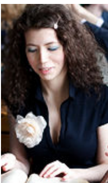
Marina 24 Jahre