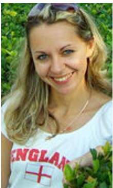
Victoria 24 Jahre