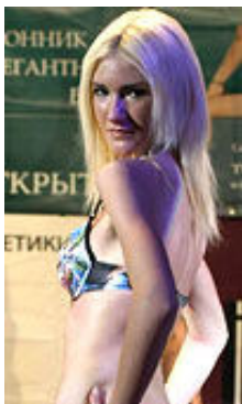
Nina 22 Jahre