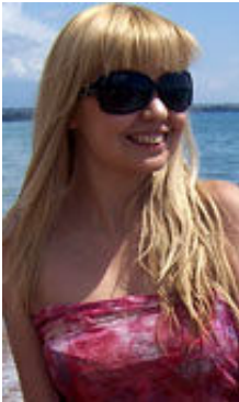
Lilya 31 Jahre