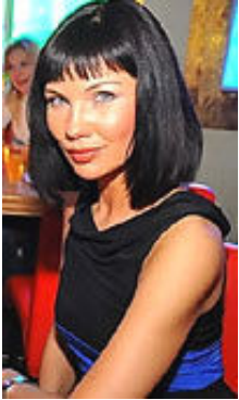
Marina 31 Jahre