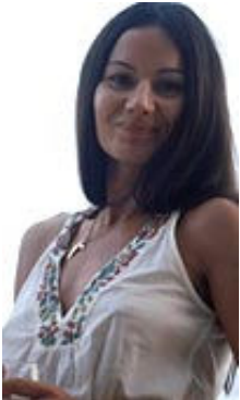
Miya 38 Jahre