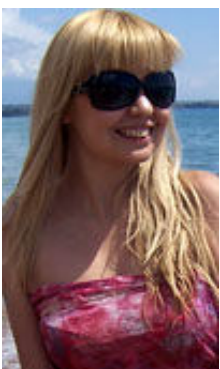
Lilya 31 Jahre