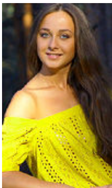
Vita 22 Jahre