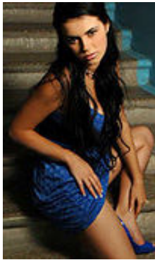
Vitalia 25 Jahre