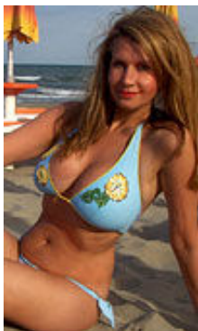
Lada 36 Jahre